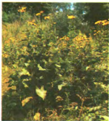
580. Оман високий.